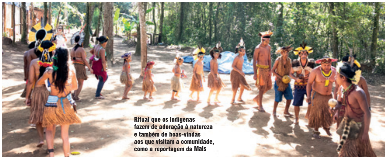
Ritual que os indígenas fazem de adoração à natureza e também de boas-vindas aos que visitam a comunidade, como a reportagem da Mais