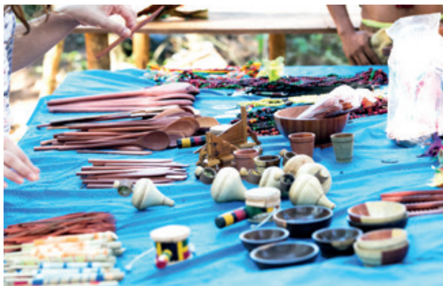
Tragédia destruiu projeto de vida da comunidade indígena em Bicas, que tinha interesse em se constituir como referência na região com venda de artesanato