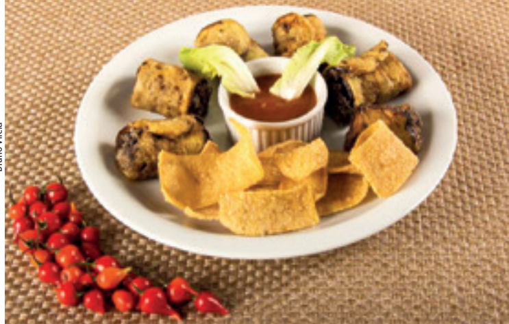
Rolezinhos empanados de berinjela recheados com funghi e shitake, acompanhados de pururuca e molho madeira veganos, formam o prato Vegano di Buteco, vencedor da 20ª edição do concurso Comida di Buteco

“Eu acordava antes das 5h, todos os dias, para testar o prato. Tinha muitas ideias a partir de coisas que eu já fazia e sabia que queria empanados com recheio de cogumelos. A pururuca, eu tinha desenvolvido em outro prato totalmente vegano anos antes e decidi que ela ia entrar como um coadjuvante muito forte junto com os rolinhos de berinjela”, relembra o proprietário do Tanganica.