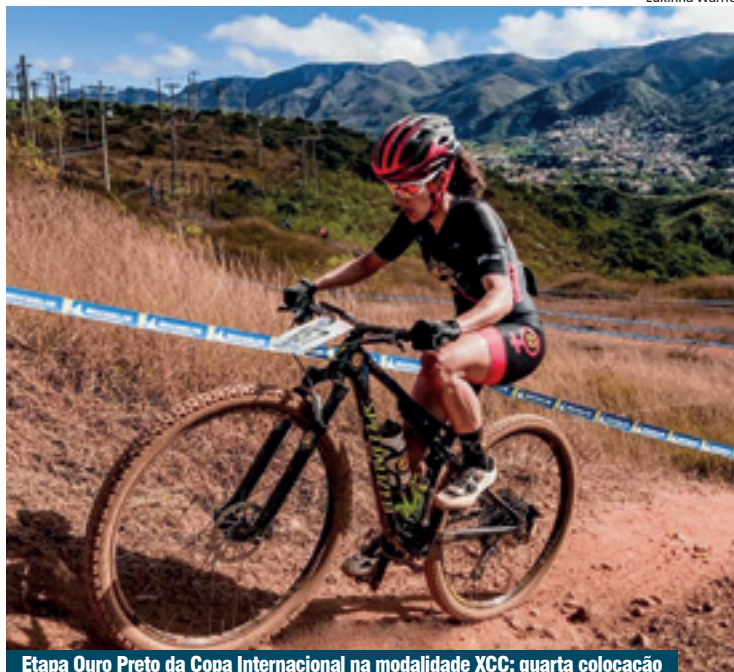
Etapa Ouro Preto da Copa Internacional na modalidade XCC: quarta colocação