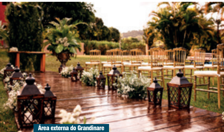
Área externa do Grandinare