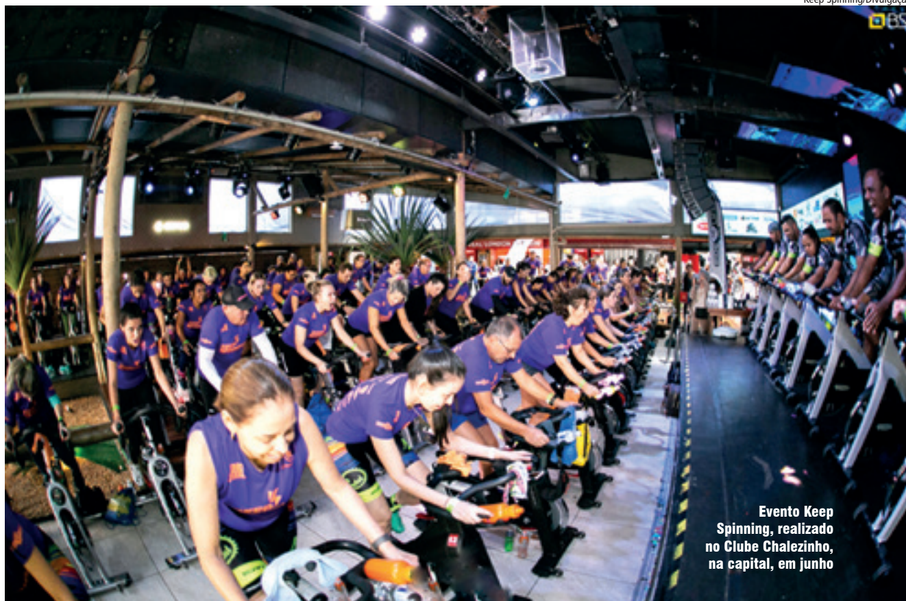
Evento Keep Spinning, realizado no Clube Chalezinho, na capital, em junho