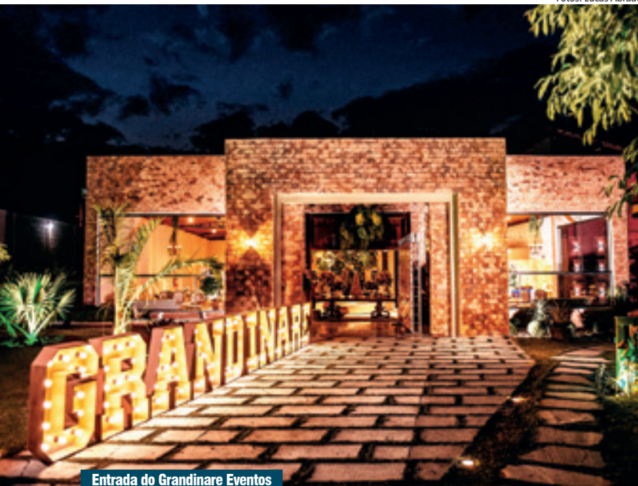
Entrada do Grandinare Eventos