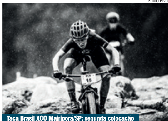
Taça Brasil XCO Mairiporã/SP: segunda colocação