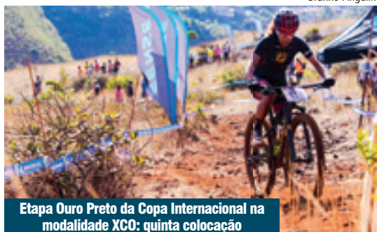
Etapa Ouro Preto da Copa Internacional na modalidade XCO: quinta colocação