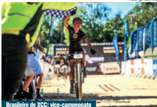
Brasileiro de XCC: vice-campeonato